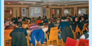
Düzce Temsilciliği Seminer Düzenledi