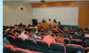
Söyleşi Krizle Karşı Haklarımız