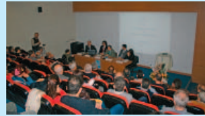
Panel Ankara Su Sorunu ve Suyun Ticarileşmesi