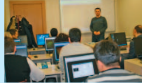
Bilgisayar Destekli Yapı Tasarımı Mühendislik Yapılarının Sonlu Elemanlarla Analizi-2 (İleri Seviye) Kursu