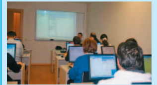
"Makro Programlama" Kursu

TMMOB İnşaat Mühendisleri Odası Ankara Şubesi'nin aylık yayın organıdır. İMO Ankara Şubesi üyelerine ücretsiz gönderilir.