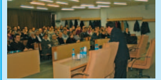
"Aşırı Yük Altında Betonarme Yapılar" Seminerleri