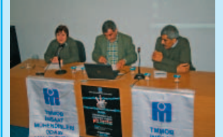
Panel Orta Doğu'nun Kanayan Yarası: Filistin