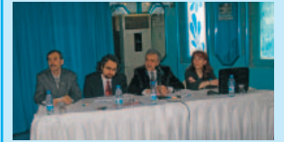
İMO 41. Dönem 3. Danışma Kurulu Toplantısı