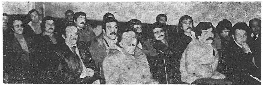
Konferans ve Seminerlerden görüntüler.