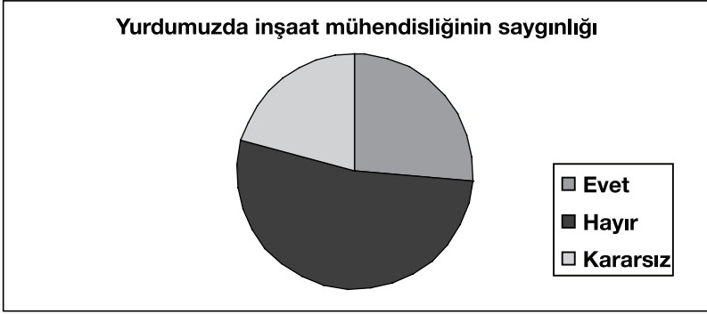
Şekil 3. Yurdumuzda inşaat mühendisliğinin saygınlığı

İnşaat mühendisliğinin yurdumuzda saygın bir meslek olarak algılanıp algılanmadığını belirlemek amacı ile sorulan sorulara verilen yanıtlar, üyelerin mesleklerinin Türkiye’de %26 oranında saygın bulunduğunu, %53 oranında saygın bulunmadığını düşündüklerini göstermektedir. %21’lik bir grup, bu konuda kararsız olduğunu ifade etmektedir. Şekil 3. bu durumu göstermektedir.